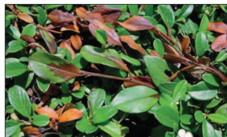
Cotoneaster dammeri (Bodendecker) mit Feuerbrandbefall.