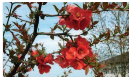
Feuerbusch (Scheinquitte bzw. Chaenomeles ) der sehr früh blüht.