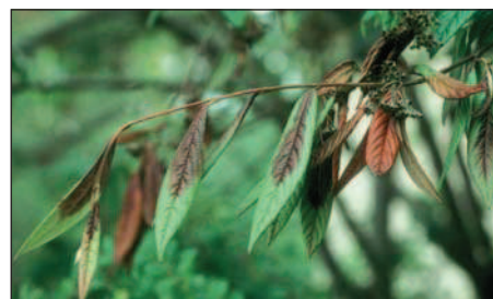
Cotoneaster salicifolius mit typischen Feuerbrand-Symptomen.