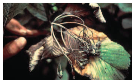
Mehlbeere ( Sorbus aria ) nach Blüteninfektion.