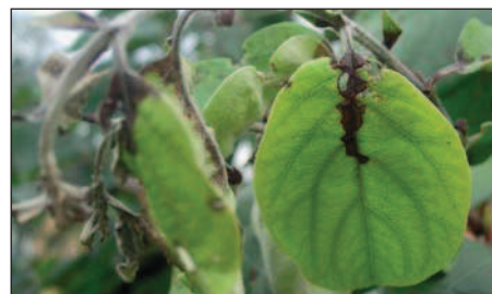
Quitte mit verdächtigem Symptom, Verbräunung vom Blattstiel her.

Feuerbrand ist eine meldepflichtige Krankheit!