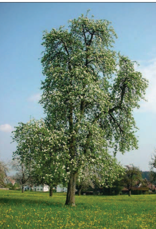
Der Feuerbrand bedroht auch die Kernobst-Hochstämme und damit das Landschaftsbild.

Feuerbrand ist eine gefährliche, meldepflichtige Pflanzenkrankheit, die durch Bakterien verursacht wird. Grosse wirtschaftliche Schäden können in Obstanlagen, Baumschulen und Hochstammobstgärten entstehen. Wild- und Ziergehölze tragen als Infektionsquellen wesentlich zur Ausbreitung der Krankheit bei. Für Cotoneaster und Photinia davidiana (Lorbeermispel) besteht seit 1. Mai 2002 eine schweizerische Verordnung, welche Produktion, Inverkehrbringen und Pflanzung verbietet. Einzelne Kantone haben dieses Verbot auf weitere Feuerbrand-Wirtspflanzen ausgeweitet.